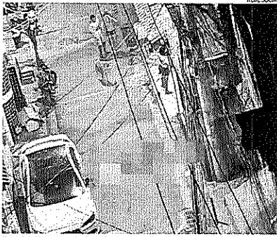
Rua Araticum, no bairro do Anil: violência por causa de território

De acordo com a PM, na segunda, agentes do 18º BPM (Jacarepaguá) foram verificar ocorrência de disparos de arma de fogo na região. No local, a equipe encontrou um homem já morto. A ocorrência foi encaminhada para a Delegacia de Homicídios da Capital (DHC). Segundo o Instituto Fogo Cruzado, tiros foram ouvidos por volta das 23h20.