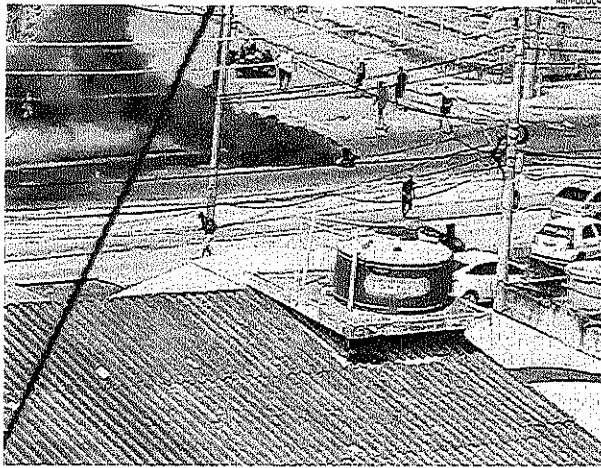
Populares atearam fogo durante manifestação na Rua Cândido Benício. Bope dá apoio ao 18º BPM na região

Antes do confronto de ontem, o bairro viveu momentos de tensão no fim de semana. No domingo, um grupo de moradores da Chacrinha ateou fogo em pneus e pedaços de madeira na Rua Cândido Benício, sentido Madureira. Na altura da estação Ipase do ERT. Por conta do ato, a circulação entre as estações Tanque e Pinto Teles, ficou interrompida por cerca de uma hora. Já o Morro do Jordão registrou