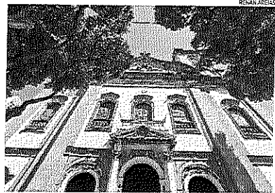
Igreja de São Francisco de Paula, no Centro, teve objeto furtado

O suspeito de roubar o ostensório da Igreja de São Francisco de Paula, no Largo São Francisco, no Centro do Rio de Janeiro, foi visto nas proximidades da paróquia horas depois de ter sido preso, na última segunda-feira. Ele chegou a ser detido pela Polícia Militar na Avenida Presidente Vargas, na parte da tarde, e encaminhado para a 5ª DP (Mem de Sá), mas foi solto no mesmo dia. O crime aconteceu no último sábado e câmeras de segurança flagram a peça sendo retirada de dentro de um armário e levada do local.